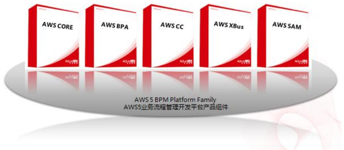
上图 AWS5 平台组件

为了适应不同方案领域的部署需要，在 AWS5 版本之后，我们将平台拆分成几个关键产品组件，这些组件可针对特定场景灵活组合使用。在使用这些组件时，您可以通过 AWS BPM CONSOLE 的同一个 Web 页面访问所有工具，并不会因为组件间的组合给您带来操作上的不便或学习曲线，因为在底层架构上的设计是一体化的，部署 AWS 能够为您带来在流程平台、业务平台和集成平台的三合一的能力提升。