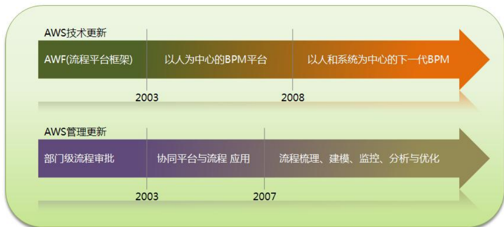
上图 AWS 技术与管理理念创新路线

AWS 的成长是持续不断的改进和创新过程，以能够为合作伙伴和用户实现 BPM 业务流程管理的最佳体验，并将这些技术融入引入到最前沿的管理理念中。