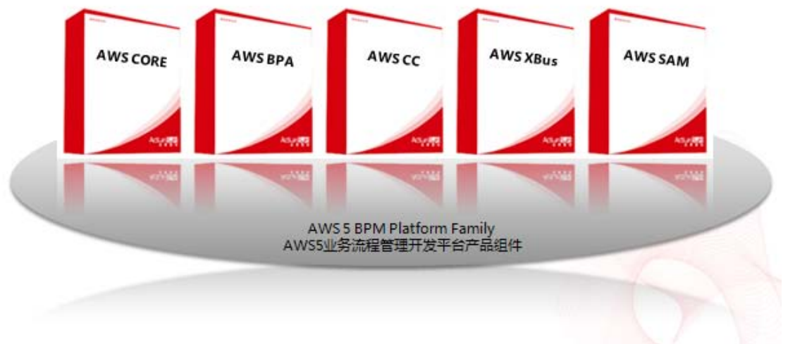
上图 AWS5 平台组件

为了适应不同方案领域的部署需要，在 AWS5 版本之后，我们将平台拆分成几个关键产品组件，这些组件可针对特定场景灵活组合使用。在使用这些组件时，您可以通过 AWS BPM CONSOLE 的同一个 Web 页面访问所有工具，并不会因为组件间的组合给您带来操作上的不便或学习曲线，因为在底层架构上的设计是一体化的，部署 AWS 能够为您带来在流程平台、业务平台和集成平台的三合一的能力提升。