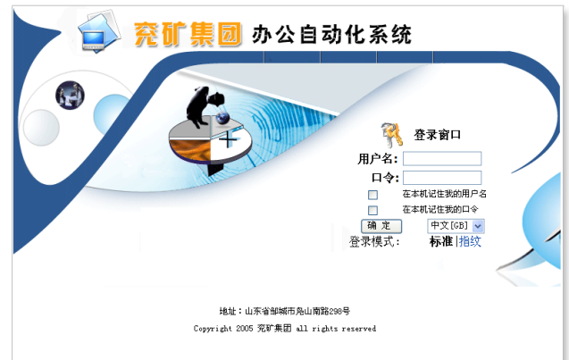
兖矿 OA 办公平台