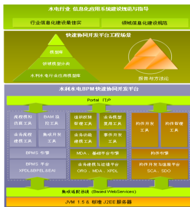
水利水电 BPM 平台关键组件功能架构