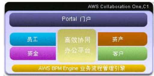
C1 中小企业解决方案

C1, Collaboration One 是炎黄盈动专门针对中小企业量身定做的一款融合办公、协同、知识、流程于一体的协同管理软件。为零售、连锁领域的中小企业提供一体化协同管理解决方案(详细信息可与炎黄盈动当地 C1 渠道代理商联系)。