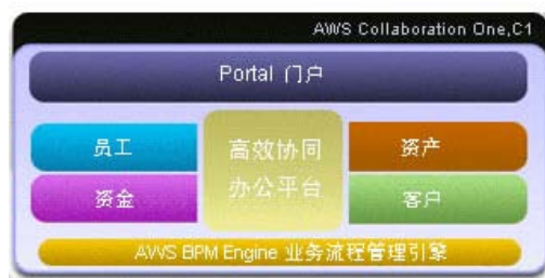
C1 中小企业解决方案

C1, Collaboration One 是炎黄盈动专门针对中小企业量身定做的一款融合办公、协同、知识、流程于一体的协同管理软件。为饮料、食品领域的中小企业提供一体化协同管理解决方案(详细信息可与炎黄盈动当地 C1 渠道代理商联系)。